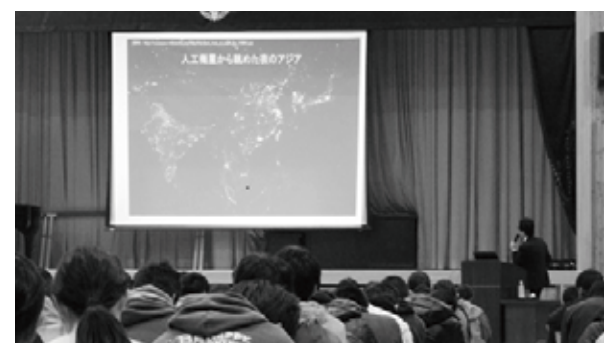
飯田高等学校(学年単位講演会方式)