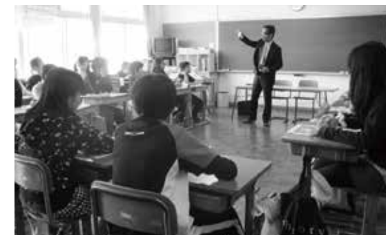
永明小学校(金融教育教室<年間シリーズ方式>)